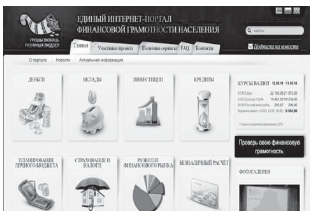
Рис. 3. Главная страница единого интернет-портала финансовой грамотности населения

экономической и финансовой безопасности, а также противодействия отмыванию денег и финансированию терроризма.